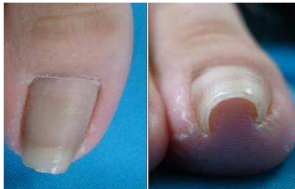
Figura 1: Vista dorsal y frontal de una uña en pinza. 13

La uña en pinza es considerada una distrofia con hipercurvatura transversal de la lámina ungueal a lo largo del eje longitudinal 1,2,3,4,5,6,8,9,10,11,12 donde la uña presenta un estrechamiento de la anchura y un aumento de la altura de la uña. 1,5,13 (Figura 1).